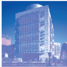
株式会社 大阪国際会議場 OSAKA INTERNATIONAL CONVENTION CENTER CORP. TEL:06-4803-5555 FAX:06-4803-5620

日時 平成15年2月7日(金) 10時～16時 場所 グランキューブ大阪 (大阪府立国際会議場) 参加定員 500名(先着順) ※原則1施設1名でお願いします。 申込締切 1月20日(月) 必着