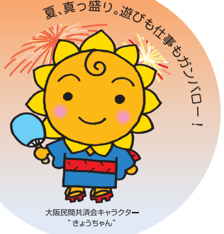
大阪民間共済会キャラクター "きょうちゃん"