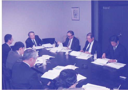
資産運用委員名簿

協議の結果決定いたしました。政策資産配分は、国内株式 29%・国内債券 25%・外国株式(為替ヘッジ無) 19.3%・外国債券(為替ヘッジ付) 10.0%・外国債券(為替ヘッジ無) 6.7%・短期金利商品10.0%です。