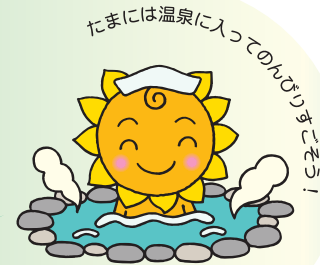
大阪民間共済会キャラクター "きょうちゃん"