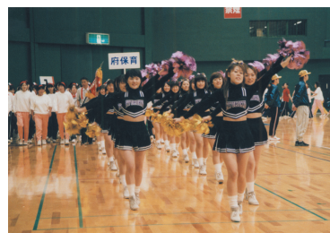
第29回大会入場行進

大会開催要項と申込書を同封しましたので、施設毎に参加者をとりまとめて、10月29日(金)までにお申し込み下さい。