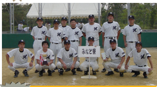
準優勝 みなと寮チーム