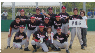
優勝 平尾荘チーム

第26回軟式野球大会は、17チームが参加し、9月9日(木)舞洲スポーツアイランド球技広場で開催しました。結果は次のとおりです。