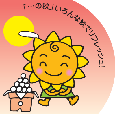
大阪民間共済会キャラクター 「きょうちゃん」