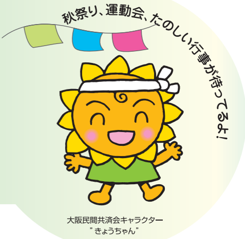
大阪民間共済会キャラクター「きょうちゃん」