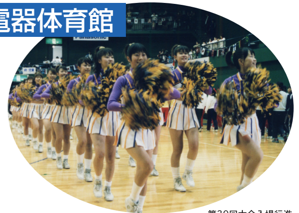
第30回大会入場行進

申込みにつきましては、開催要項をご確認のうえ、専用申込書にてお申し込み下さい。締切は10月28日(金)です。