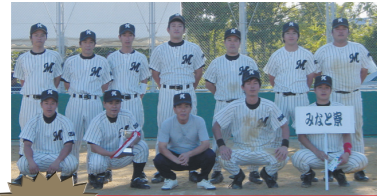
優勝 みなと寮チーム