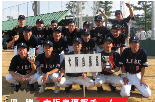
優勝 大阪自彊館チーム