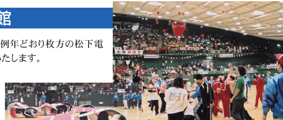
第31回大会の玉入れ

開催要項と申込書を同封しましたので、施設単位に参加者を取りまとめで、お申込み下さい。