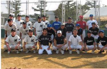
第3位 みなと寮チーム 大阪市児童施設連盟チーム