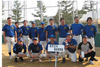
準優勝 四天王寺福祉事業団チーム