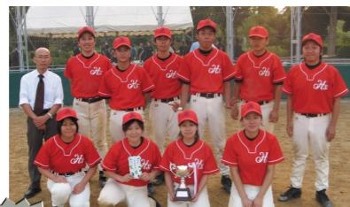
準優勝 日本ヘレンケラー財団B