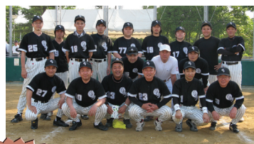
第3位 大阪府社会福祉事業団