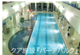
クア施設『バーデパルク』