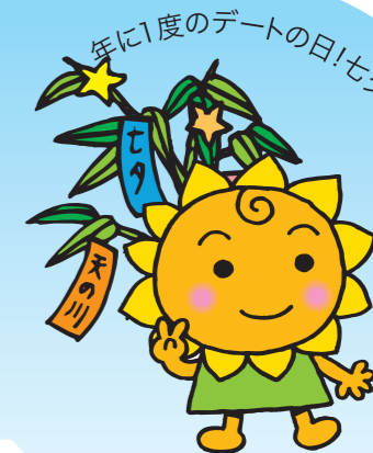
大阪民間共済会キャラクター "きょうちゃん"