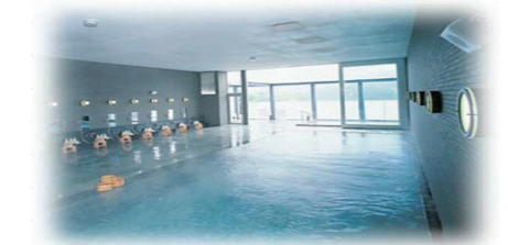
霧生温泉・香楽の湯

モデルプランコース (1例です) 10:00頃 ご自宅出発 14:30 温泉入浴等 12:00 メナード着・昼食 16:00 メナード出発 13:00 コスメ体験 18:00頃 ご自宅到着