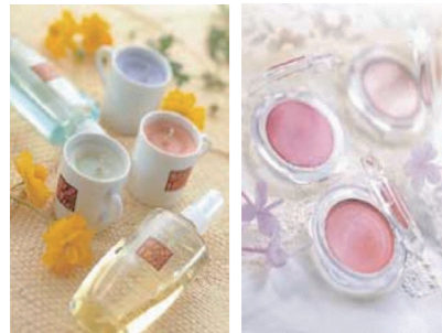
フレグランスアイテム (アロマグッズイメージ) リップアイテム (リップカラーイメージ)

昼食 フレンチミニコース or おすすめ膳(和食) 特典 ●コスメ体験教室付き● リップカラー・カラーパウダー または ルームフレッシュナー等のアロマグッズアイテム創り ※詳しい内容はお問合せ下さい ●霧生温泉・香楽の湯入浴サービス● (タオル・バスタオル完備)