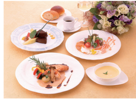
フレンチミニコース(イメージ)

昼食 フレンチミニコース or おすすめ膳(和食) 特典 ●コスメ体験教室付き● リップカラー・カラーパウダー または ルームフレッシュナー等のアロマグッズアイテム創り ※詳しい内容はお問合せ下さい ●霧生温泉・香楽の湯入浴サービス● (タオル・バスタオル完備)