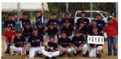
優勝 大阪自彊館チーム