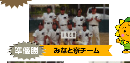
準優勝 みなと寮チーム