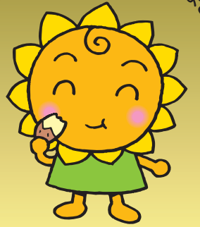
大阪民間共済会キャラクター 「きょうちゃん」