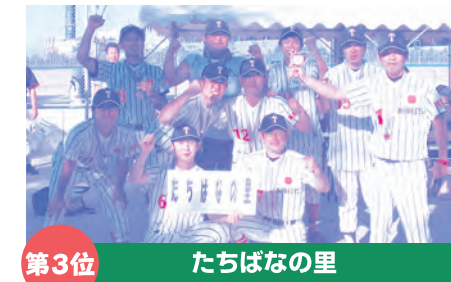
第3位 たちばなの里