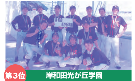
第3位 岸和田光が丘学園