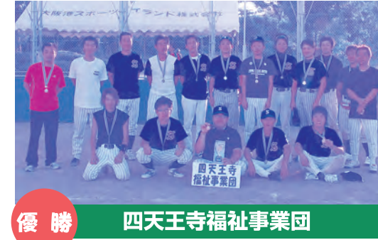
優勝 四天王寺福祉事業団