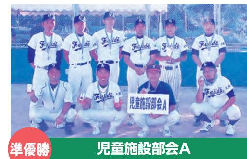
準優勝 児童施設部会A