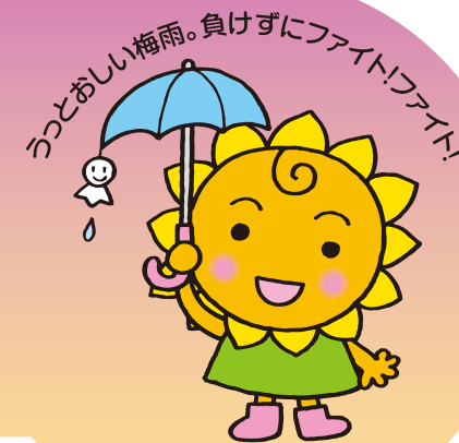
大阪民間共済会キャラクター "きょうちゃん"