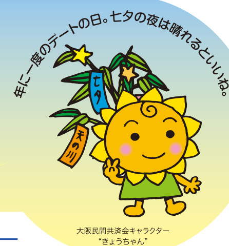
大阪民間共済会キャラクター 「きょうちゃん」