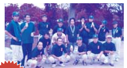
第3位 桃林会祥雲館