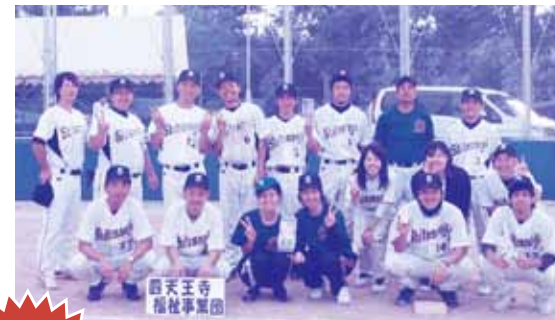
優勝 四天王寺福祉事業団