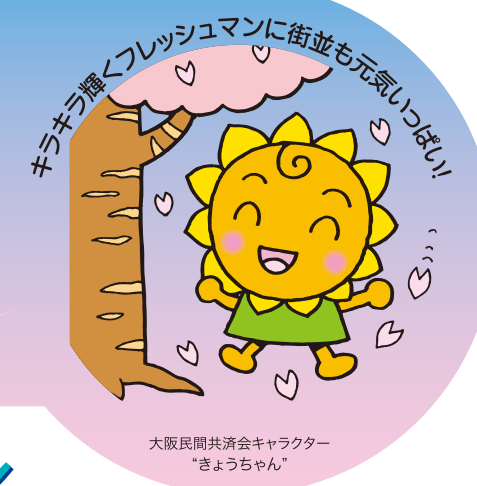
大阪民間共済会キャラクター "きょうちゃん"