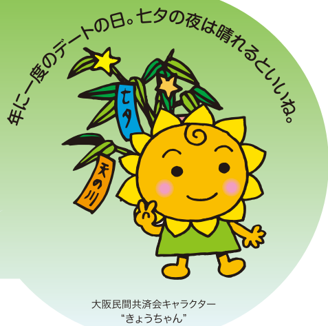
大阪民間共済会キャラクター「きょうちゃん」

2013年度「ライフサポート倶楽部ガイドブック」を各事業所に1冊と、「共済会のしおり」を1人1冊配布させていただきました。新しいメニューを始め、共済会会員様だけがご利用いただける特別メニューなどございますので是非ご利用ください。