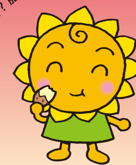
大阪民間共済会キャラクター "きょうちゃん"