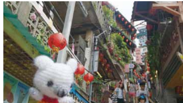
千と千尋のアニメっぽい町並みの九份

初日は空港に到着後、バスで九份に連れて行ってもらいました。山の坂道に階段があり、その両脇にお店が寄り添うように並んでいて、その軒先には赤いちょうち