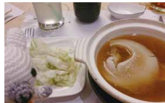
こんなに大きなフカヒレ! (ウェルカムパーティーにて)

夜は自由行動で、台湾の京劇を観賞しました。お芝居は中国語ですが、舞台の横で日本語字幕が出ていま