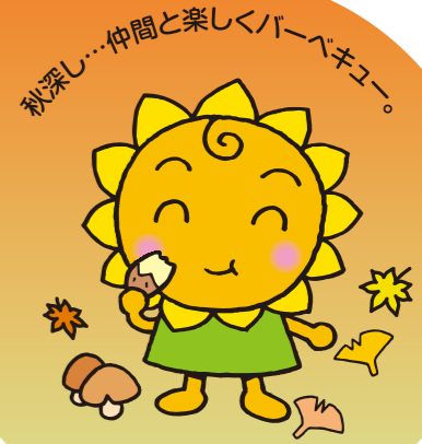
大阪民間共済会キャラクター "ぎょうちゃん"