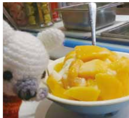
マンゴーいっぱいのかき氷(夜市にて)

夜は夜市にタクシーで自由行動。現地の人や観光客で夜だというのにすごい賑わいでした。向かい合うお店は歩道らしき道にもお店が広がっていて、車道の中央も屋台が所狭しと出ていて、人混みとお店から漂う匂いと暑さで苦しいぐらいの熱気でした。屋台に並ぶ品物も独特で、黒焦げのアヒルの首や鶏の足首が山盛りであったり、豚の丸焼きが置かれていたり見て歩くだけで驚きと興奮のアドベンチャーを味わえました。見るだけでは勿体ないので、マンゴーのかき氷を食べましたが、