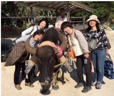
竹富島集落での水牛観光にて

リフレッシュプランの言葉どおりリフレッシュできました。楽しい旅行をありがとうございました。