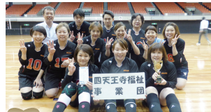
第3位 四天王寺福祉事業団