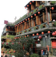
九份の阿茶茶酒館

7月29日から、2泊3日の台北旅行に参加しました。初日は、空港からバスで九份へ連れて行ってもらいました。以前、映画で観た「千と千尋の神隠し」の世界を彷彿させる景色の中、細く長い階段を吹き出る汗を拭きながら登り、色々なお店を見て楽しみました。