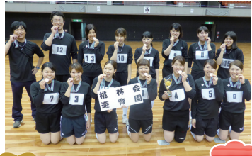
優勝 桃林会 遊育園 2連覇!