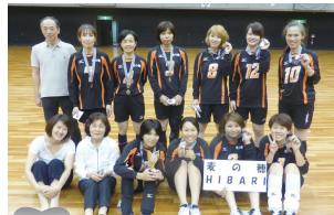
準優勝 麦の穂 HIBARI