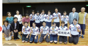
第3位 成光苑 A