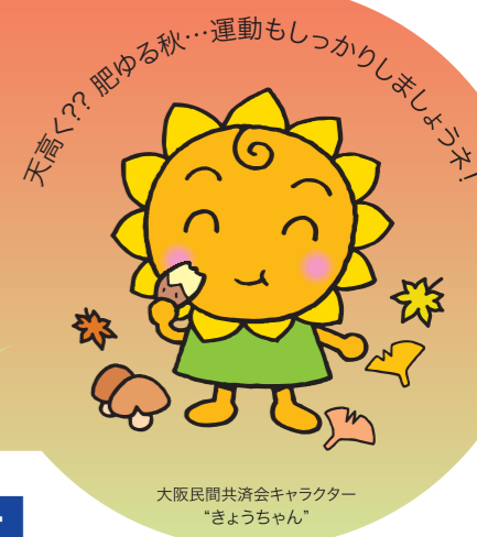
大阪民間共済会キャラクター 「ぎょうちゃん」