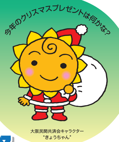
大阪民間共済会キャラクター "きょうちゃん"