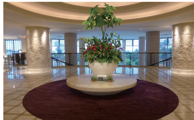
石垣市:ANAインターコンチネンタル石垣リゾートロビー

今回で5回目を迎えたリフレッシュ事業:沖縄(八重山)ツアーは、10月13日(金)から15日(日)の3日間で、20人のご参加をいただき、開催しました。 3日間とも、気圧の谷の影響で曇りや雨また、時折晴れ間も覗く中、参加者の皆様は八重山観光を楽しんでいただきました。