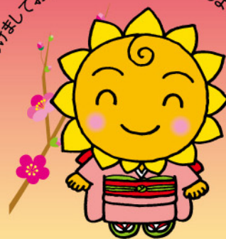
大阪民間共済会キャラクター "きょうちゃん"