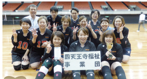
第3位 四天王寺福祉事業団