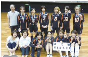
準優勝 麦の穂 HIBARI