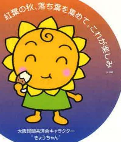
大阪民間共済会キャラクター「きょうちゃん」