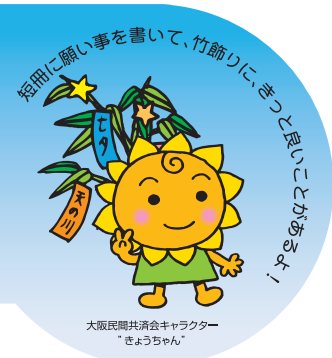
大阪民間共済会キャラクター "きょうちゃん"