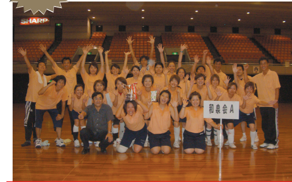
和泉会 A チーム