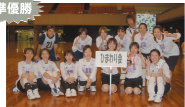
ひまわり会チーム