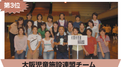
大阪児童施設連盟チーム 高津学園チーム