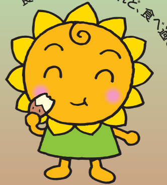
大阪民間共済会キャラクター 「きょうちゃん」