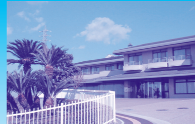
トゴールの湯・テニス・夏期プール