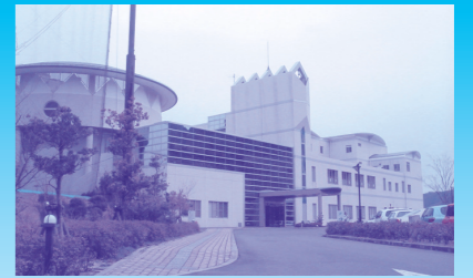
展望大浴場・テニス・ゴルフ練習場