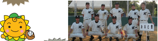
準優勝 みなと寮チーム