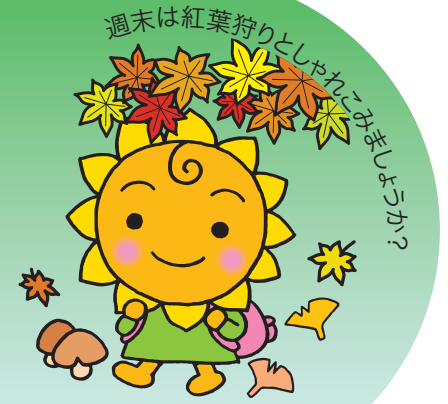
大阪民間共済会キャラクター “きょうちゃん”