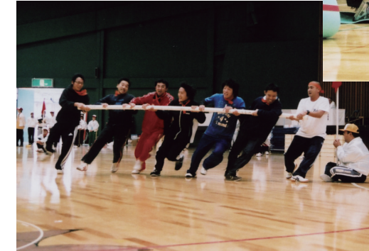
第32回大会の台風ゲーム

開催要項と申込書を同封しましたので、施設単位に参加者を取りまとめて、お申し込み下さい。