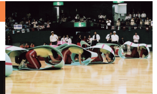
第32回大会のキャタビラレース