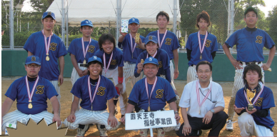
優勝 四天王寺福祉事業団チーム