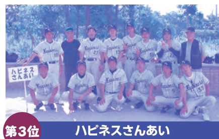
第3位 ハビネスさんあい