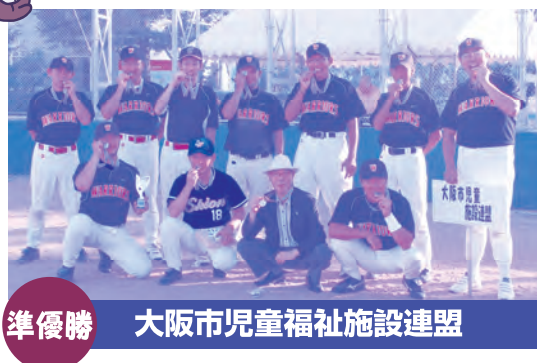
準優勝 大阪市児童福祉施設連盟