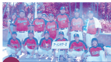
第3位 アーバンケアーズ