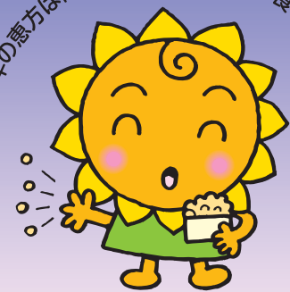
大阪民間共済会キャラクター 「きょうちゃん」