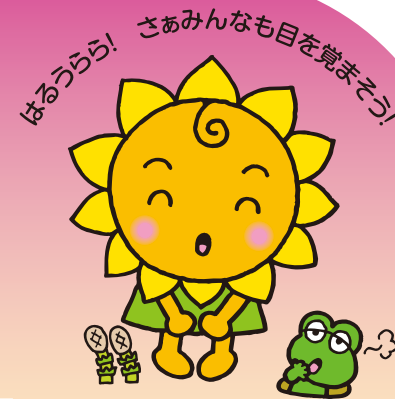
大阪民間共済会キャラクター “きょうちゃん”