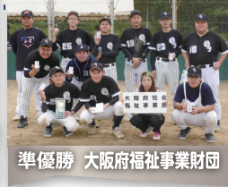
準優勝 大阪府福祉事業財団