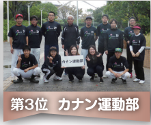
第3位 カノン運動部