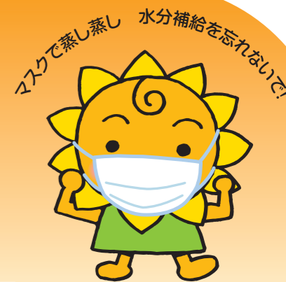
大阪民間共済会キャラクター “きょうちゃん”